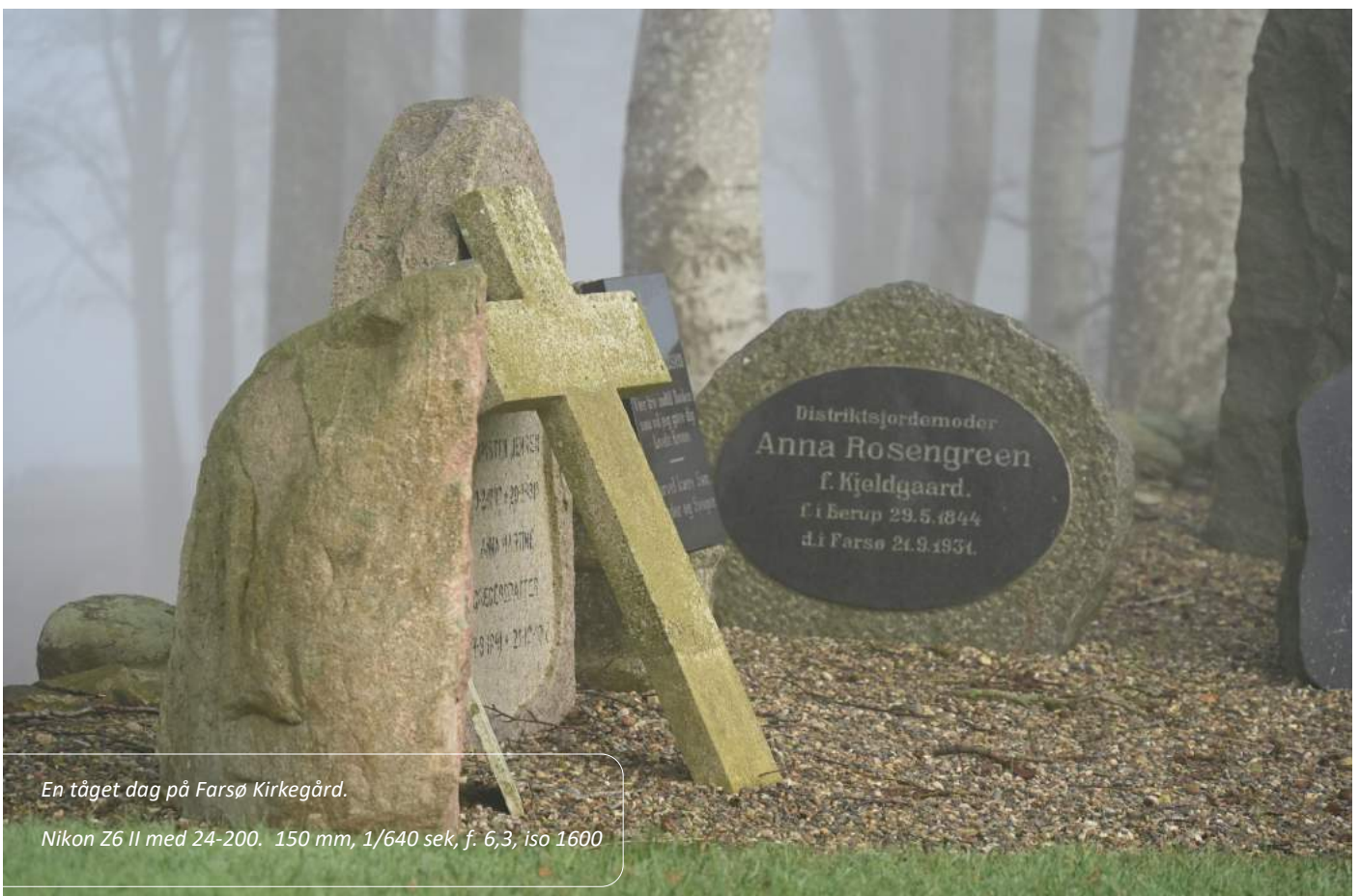
En tåget dag på Farsø Kirkegård.

Næste gang tågen lægger sig, bør du fatte kameraet og komme af sted - motiverne gemmer sig derude i det slørede landskab.