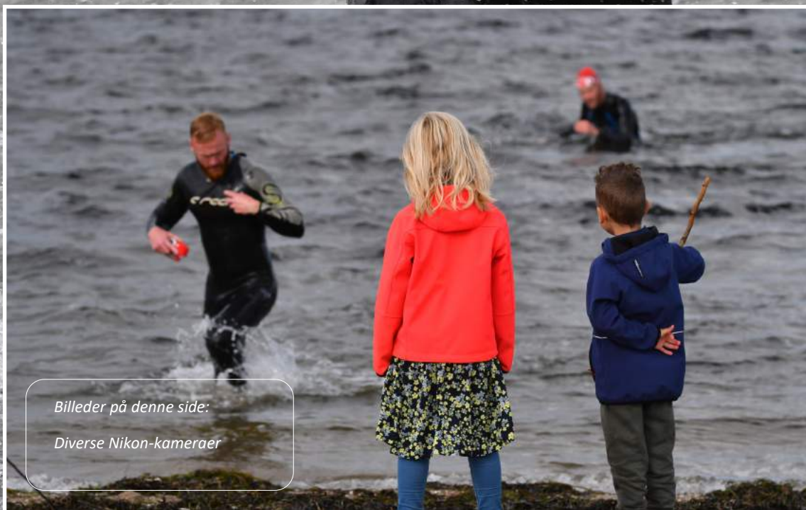
Billeder på denne side: Diverse Nikon-kameraer